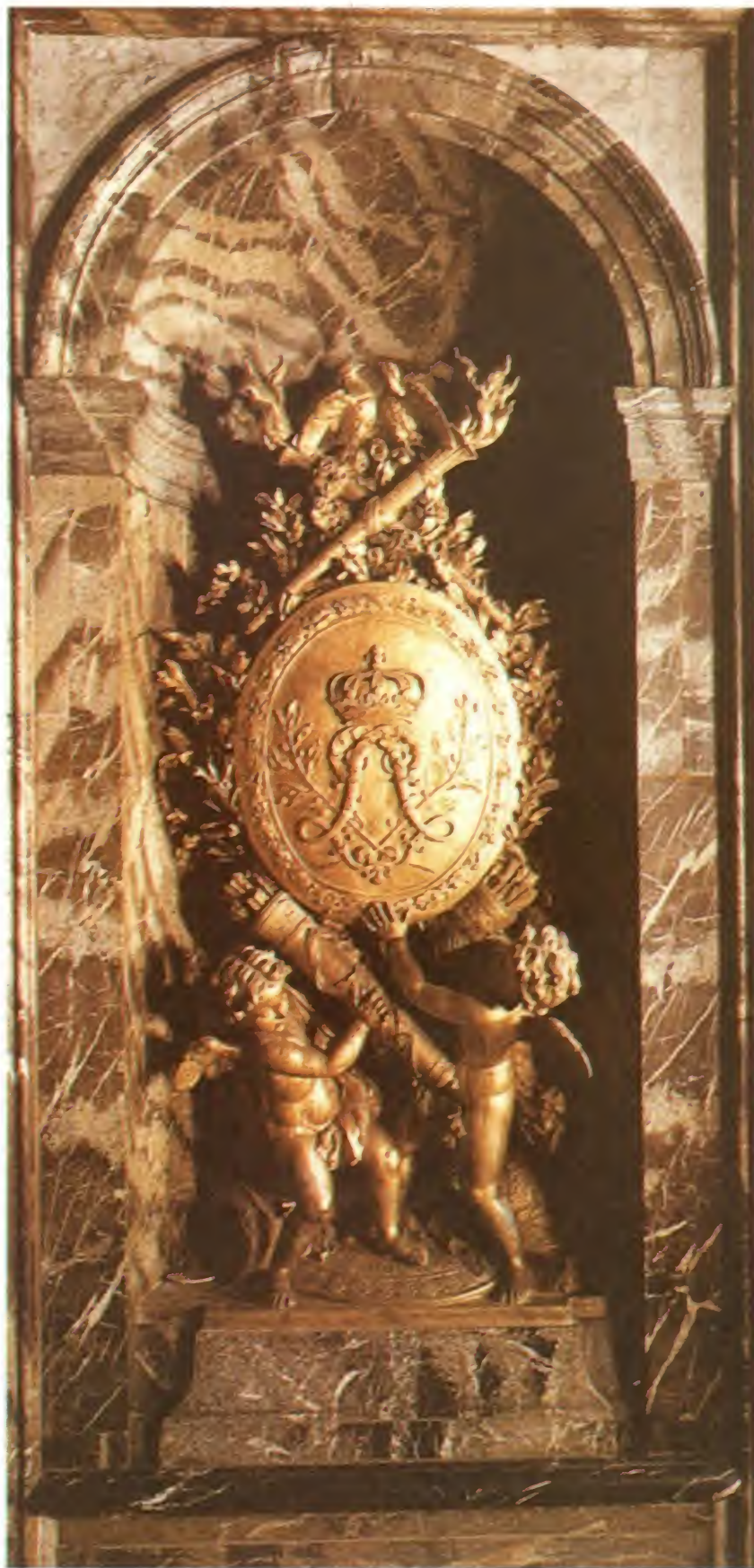
Símbolo del matrimonio entre Luis XIV y María Teresa de Austria (grupo escultórico en plomo dorado, Versalles)

ligada al proceso de consolidación del poder monárquico que se desarrolló en el interior del reino. Sin el fortalecimiento de la Monarquía y de su infraestructura administrativa, el rey hubiera sido incapaz de reunir hombres y dinero en la medida en que lo hizo, ni hubiera tampoco podido enfrentar a su pueblo a un proceso bélico tan intenso y tan prolongado. La monarquía absoluta hizo posibles las victorias militares y éstas, a su vez, fortalecieron el prestigio de la Corona —al menos en los primeros años.